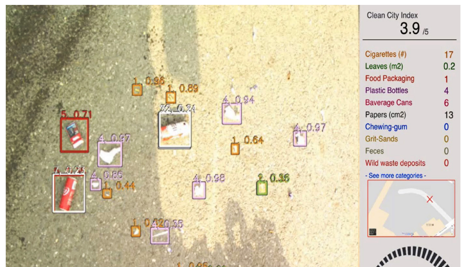
Die 4K-Kamera liefert in 24 Stunden mehr als 100 Gigabyte Daten, welche den Müll auf der Strasse oder Trottoir zeigen. Die bordeigene Auswerteelektronik kann bis zu einer Fahrgeschwindigkeit von 40 km/h die Gegenstände dank künstlicher Intelligenz erkennen.